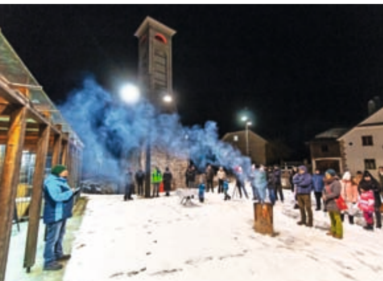
S prireditve Pred plavžem mi pesem povej

Večer nam je minil v lepem pričakovanju 8. februarja, ko Slovenci s ponosom praznujemo svoj kulturni praznik.