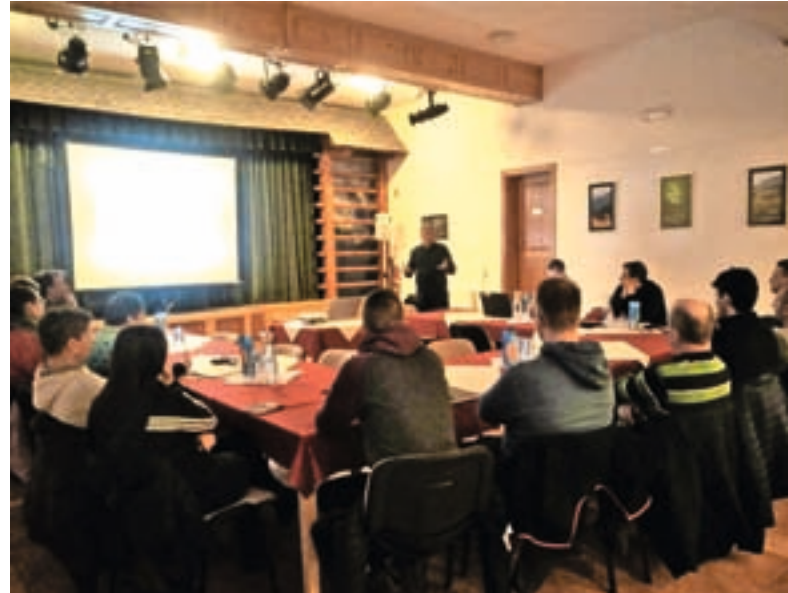
Utrinek s predstavitve v Sorici

Naj spomnimo, da je že v lanskem letu potekal terenski ogled in ocenjevanje območja, pri čemer je bilo na podlagi kriterijev primernosti, ki jih združenje predpisuje, ugotovljeno, da zgornji del Selške doline omenjene kriterije v celoti izpolnjuje in je zelo primeren za vključitev, medtem ko spodnji del doline zaradi intenzivne gospodarske dejavnosti in večjega števila infrastrukturnih posegov v okolje za vključitev ni primeren. Predstavitve se je skupno udeležilo šest ponudnikov iz treh krajevnih skupnosti ter trije predstavniki Občine Železniki na čelu z županom Markom Gasserjem, predstavnik združenja Gorniških vasi v Sloveniji Miro Eržen ter direktor Razvojnega agencije Sora Gašper Kleč in predstavniki Javnega zavoda Ratitovec. Javni zavod Ratitovec je predstavitev tudi organiziral in bo v primeru oddaje zaveze za pristop prevzel celotno koordinacijo ter tako gradil most med lokalno skupnostjo, ponudniki in združenjem z namenom aktivne participacije in nudenja pomoči deležnikom v lokalnem okolju na področju turizma, pohodništva in širšega trajnostnega razvoja z željo po doseganju medsebojnih pozitivnih učinkov in sinergij. Na predstavitvi so bili podani odgovori na posamezna vpra-