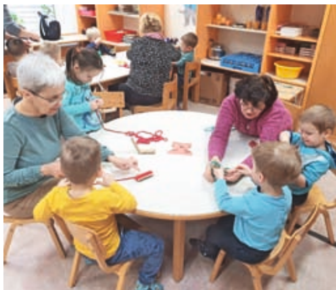
Ob pomoči upokojenk smo tudi ustvarjali iz volne.

Po novem letu smo se v skupini Mucki pogovarjali o predelavi volne in pletenih zimskih oblačilih in se domislili, da na obisk povabimo upokojenke. Z veseljem so se odzvale vabilu. Pokazale so nam, kako se pleče šale, nogavice in kape. Tudi otroci so se preizkusili v pletenju. Ker pa še nismo tako vešč, smo se odločili, da bomo iz volne navili cofe. Pomoč upokojenk je bila zelo dobrodošla. Na koncu nas je čakalo presenečenje. Gospe so za vsakega otroka napletle par nogavic, ki so jih lahko odnesli domov. Poslovlili smo se s pesmico in se dogovorili, da se še srečamo. Do konca šolskega leta bodo gotovo obiskale še kakšno skupino otrok iz našega vrtca.