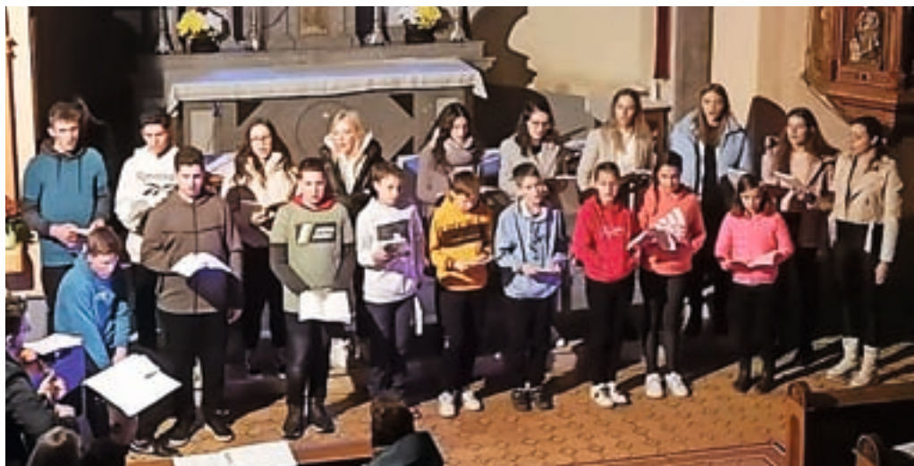
S koncerta ob 20-letnici delovanja Otroško-mladinskega pevskega zbora Davča

Zelo sem vesela in počaščena, da sem lahko del te skupnosti, prav tako pa mi