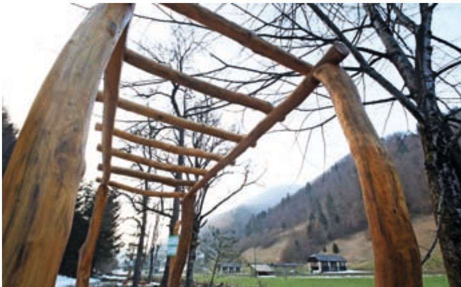
Na Zalem Logu so lani uredili trim stezo z orodji za razgibavanje. / Foto: Gorazd Kavčič

V krajevni skupnosti Dolenja vas so lanska sredstva participativnega proračuna vložili v mansardo objekta ob športnem igrišču, ki so jo zvočno in toplotno izolirali ter vgradili nov opaž.