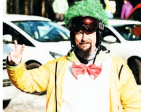
S pustovanja na Soriški planini

V nedeljo je bilo na isti lokaciji še pustno rajanje, ki so ga pripravili štirje klovnovi iz Dražgoš. »Zbrali smo se pri nekdanji trgovini v vasi pri šoli, kjer smo posneli skupno pustno fotografijo,