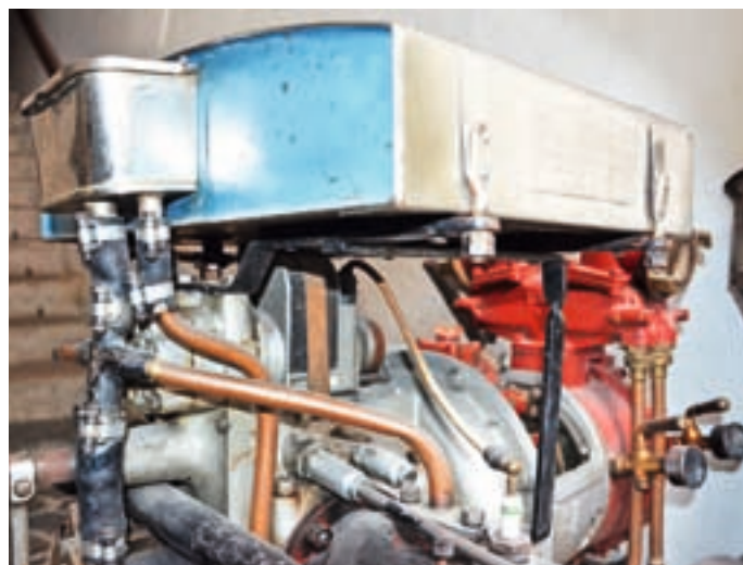
Motorna brizgalna Rosenbauer iz leta 1938