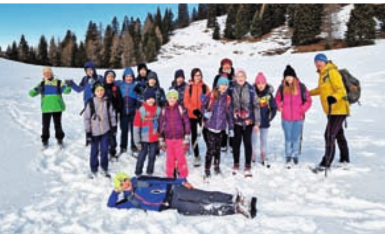
Zimske radosti na planini Korošica

Januarja vedno načrtujemo sankanje, tokrat pa smo se v čakalju na sneg podali na pohod na planino Korošica. Pod mejnim prehodom Ljubelj smo se podali po neoznačeni poti na planino. Že po dvesto višinskih metrih nas je prijetno presenetil sneg, ki ga je bilo na naše veselje za vsakim ovinkom več. Mladi planinci so na planini uživali v čudovitih razgledih in snežnih radostih. Domov smo se vračali prešerne volje, ker je bil to »najboljši planinski izlet do sedaj«.