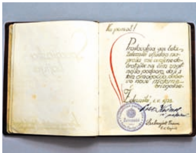
Spominska knjižica ob zbiranju prispevkov za motorno brizgalno