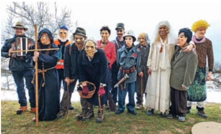
»Tastare« maškare, ki so na pustno soboto obiskale vse domove v Dražgošah