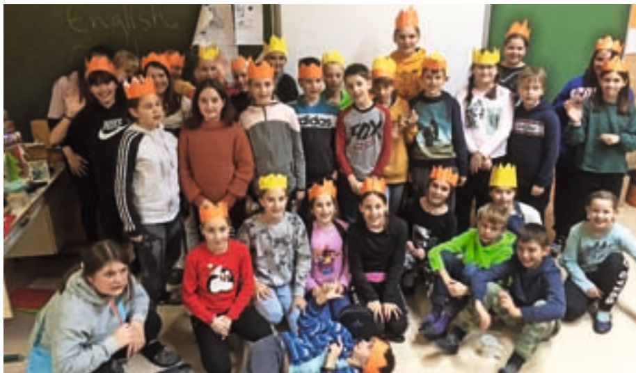
Dogajanje na angleškem božičnem popoldnevu

Franz Fanon je zapisal: »To speak a language is to take on a world, a culture.« S spoznavanjem novega jezika si tako širimo obzorja in spoznavamo nove kulture. Učiteljice angleščine smo vesele pozitivnih odzivov učencev na dodatnih jezikovnih dejavnostih in bomo tudi v prihodnje poskrbele, da bo na šoli jezikovno živahno.