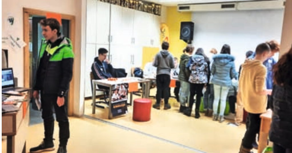
Predinformativni dnevi za osnovnošolce, imenovani Info lonec

Kot že nekaj let so tudi letos potekali predinformativni dnevi za osnovnošolce, imenovani Info lonec. Na njem srednješolci predstavijo osnovnošolcem srednjo šolo, ki jo obiskujejo, povejo,