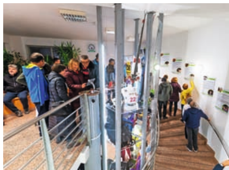
Z odprtja športne zbirke v Športni dvorani Železniki / Foto: Simon Benedičič

V četrtek, 22. decembra, smo v Športni dvorani Železniki predstavili novo stalno zbirko Muzeja Železniki, ki govori o športu v Selški dolini. Organizirani šport ima v teh krajih začetke v Sokolskem društvu (1907) in leto kasneje ustanovljenem Društvu Orel. Nadaljevanje teh tradicij je organizirana športna dejavnost, ki je zacvetela po drugi svetovni vojni s TVD Partizan Železniki in Selca in kasneje v vseh društvih, ki so izšla iz teh tradicij. Na stalni muzejski razstavi je predstavljeno športno življenje v Selški dolini od druge polovice 20. stoletja dalje: klubska in društvena športna dejavnost, del razstave je osredotočen na olimpijske igre in na športnike, ki so se jih udeležili. Kar osem jih je bilo do sedaj del olimpijskega duha in držimo pesti še za prihodnje. Osrednji del razstave so predmeti, ki so jih za razstavo podarili športniki in športni delavci. S postavitvijo na muzejsko razstavo postajajo dokument časa in prostora in del identitete krajev. Na pretekle igre spominjata kašipota pred športno dvorano, na prihodnje pa ura, ki kaže čas v kraju prihodnjih olimpijskih iger. Vabljeni, da obiščete razstavo v Športni dvorani Železniki. Javni zavod Ratitovec