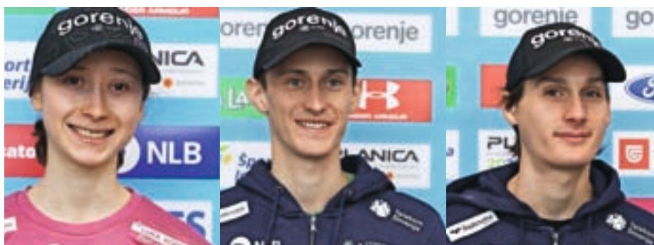
Nika, Peter in Domen Prevc so v slovenski reprezentanci, ki nastopa na svetovnem prvenstvu v Planici.

vim, učim, dodam drobtinico znanja, ki mi koristi za naslednje tekme. Iz tega naprej stopnjam formo. Planica mi ugaja in zelo se veselim tekem tam. Z zadovoljile bi me vsaj ene stopničke, medalja torej,« je razmišljal teden dni pred začetkom. Kot vsi bratje se je zelo razveselil prvih stopničk v svetovnem pokalu mlajše sestre Nike. Poudaril je, da ga ni