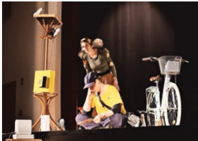
Tokrat smo vzgojiteljice otrokom pripravile predstavo Pismo za dedka Mraza.

Predstavo so si starejši otroci, ki obiskujejo vrtec, ter otroci 1. razreda Osnovne šole Železniki ogledali v Kulturnem domu Železniki. V istem tednu smo v vrtcu predstavo zaigrale tudi za naše najmlajše in otroke, ki obiskujejo enoti Selca in Dražgoše.