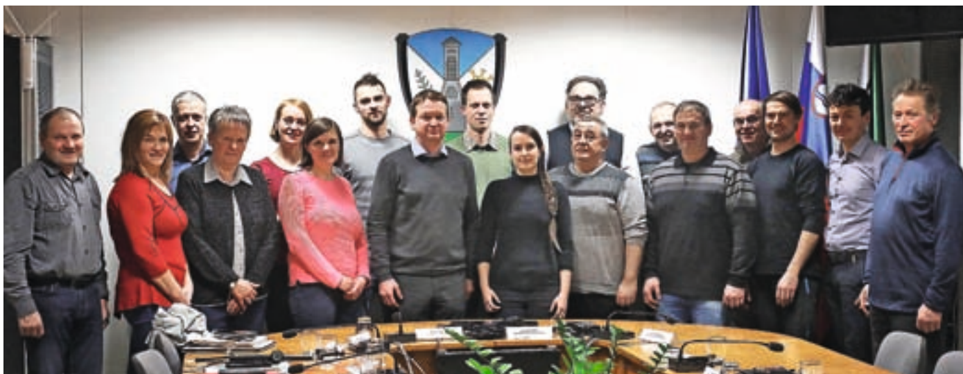
Občinski svet Občine Železniki v mandatu 2022–2026 sestavlja pet občinskih svetnic in dvanajst svetnikov.

Občinski svetniki so na januarski seji imenovali člane občinskih odborov in komisij, potrdili višje cene programov v vrtcih in z odlokom razglasili pokopališko kapelo sv. Križa v Selcih za kulturni spomenik lokalnega pomena.